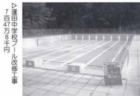
▷蓬田中学校プール改修工事 7百47万8千円