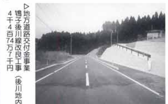
▷地方道路交付金事業 鴨子後川線改良工事 4千4百74万7千円 (後川地内)