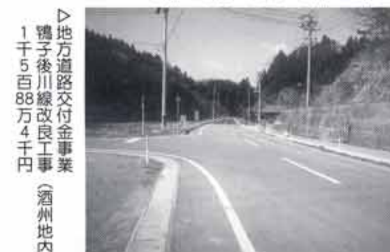
▷地方道路交付金事業 鴨子後川線改良工事 1千5百88万4千円 (酒州地内)