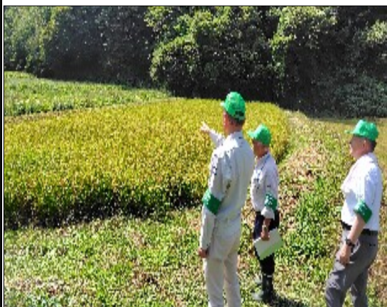
農地パトロールの様子

9月16日(火)から、村内全域を対象に農地パトロール(農地の利用状況調査)を実施しました。 この調査は、①各担当地域の農地利用の確認、②遊休農地の実態把握と発生防止・解消、③違反転用防止・早期発見を重点に取組みました。 なお、パトロールの結果「非農地」と判断された田畑については、冬頃に再度現地確認を実施します。また、必要時は、年間を通じて農業委員や農業委員会事務局職員が農地の巡回・現地確認を行うことがありますので、ご協力をお願いします。