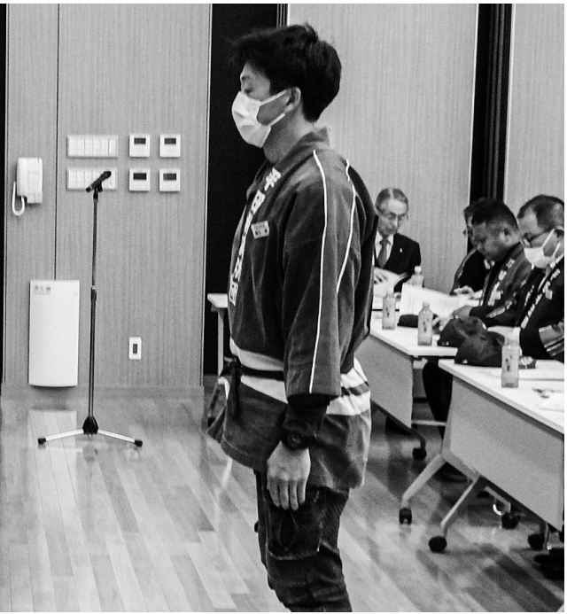
令和8年度 平田村消防団幹部一覧(敬称略)